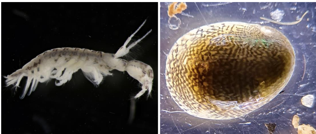
Figuur 2 Foto links: Azov slijkgarnaal en foto rechts: zoetwatermeriet.

De algehele macrofaunasamenstelling indiceert verder een relatief soortenarme gemeenschap, typisch voor een stortstenen oeverzone van een groter water met weinig variatie in structuur. Dergelijke soortensamenstellingen en habitats zijn kenmerkend voor het IJsselmeergebied. De aanleg van een vooroever zal de soortenrijkdom waarschijnlijk positief beïnvloeden, zeker als in de achterliggende lagune meer structuur wordt aangebracht, bijvoorbeeld in de vorm van dood hout.