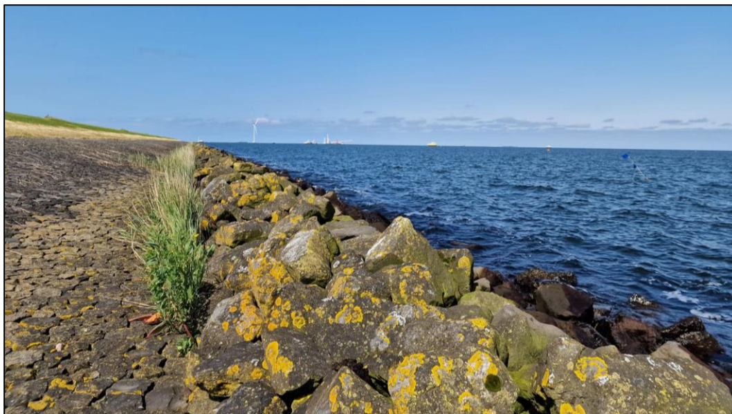
Figuur 2 Foto van één van de bemonsteringslocaties macrofauna.